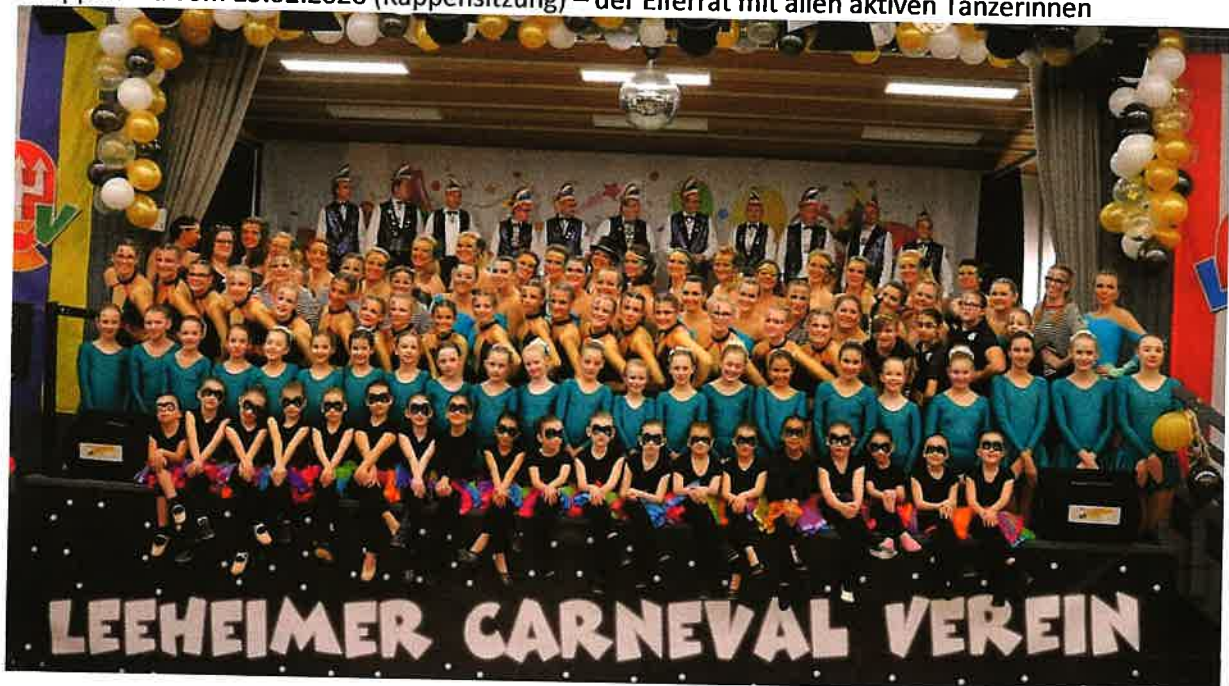
Gruppenbild vom 15.02.2020 (Kappensitzung) – der Elferrat mit allen aktiven Tänzerinnen